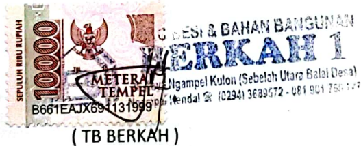
( Asyari )

PIHAK PERTAMA KPB diwakili oleh Ketua KPB